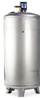
Remineraliseringsfilter N-175 RO Rostfritt stål, AISI 316L Manuell backspolning