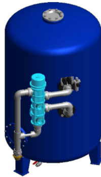
Sandfilter SA-1000 Filtertank gjord av kolstål med in- och utsida av ett icke-poreus polyetenfoder Automatisk backspolning